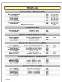
Répertoire téléphonique de la Mairie