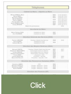
Répertoire téléphonique de la Mairie