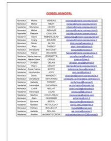
Répertoire des adresses mail du Conseil municipal