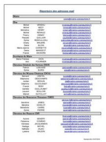
Répertoire des adresses mail de la Mairie