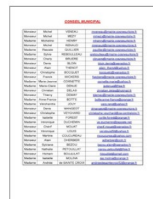
Répertoire des adresses mail du Conseil municipal