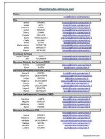
Répertoire des adresses mail de la Mairie